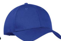
Plus léger que 294C