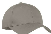
Gris froid 8C