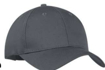
Gris froid 11C