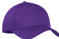
Plus foncé que 7679C