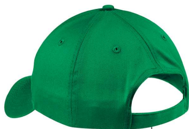
Fermeture auto-agrippante ajustable